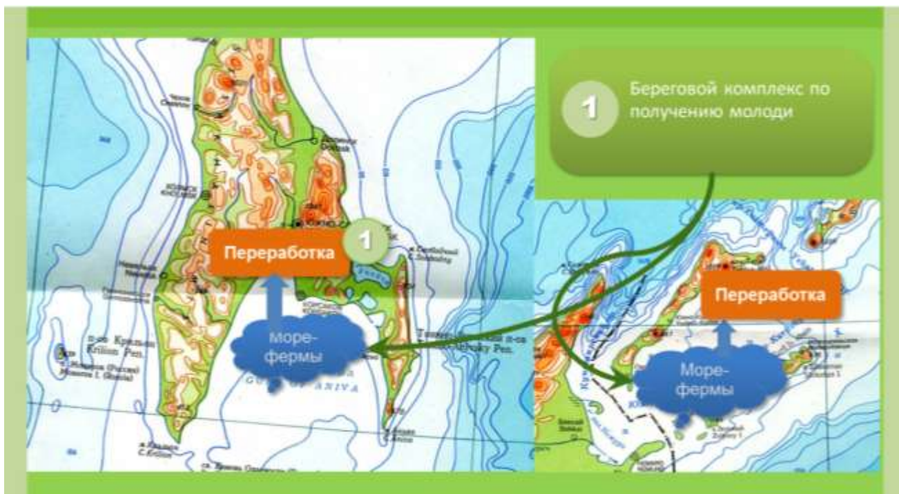
Рис. 2, - Возможный вариант пространственной организации Морского биотехнопарка при реализации первого этапа проекта

Модули Процессингового Центра, обеспечивающие первичную переработку сырья, должны располагаться по месту локализации морских хозяйств (первый - на территории соответствующих муниципальных образований южной части Сахалина и второй – на Южных Курилах).